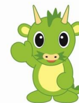
さいたま市PRキャラクター 「つなが竜ヌウ」